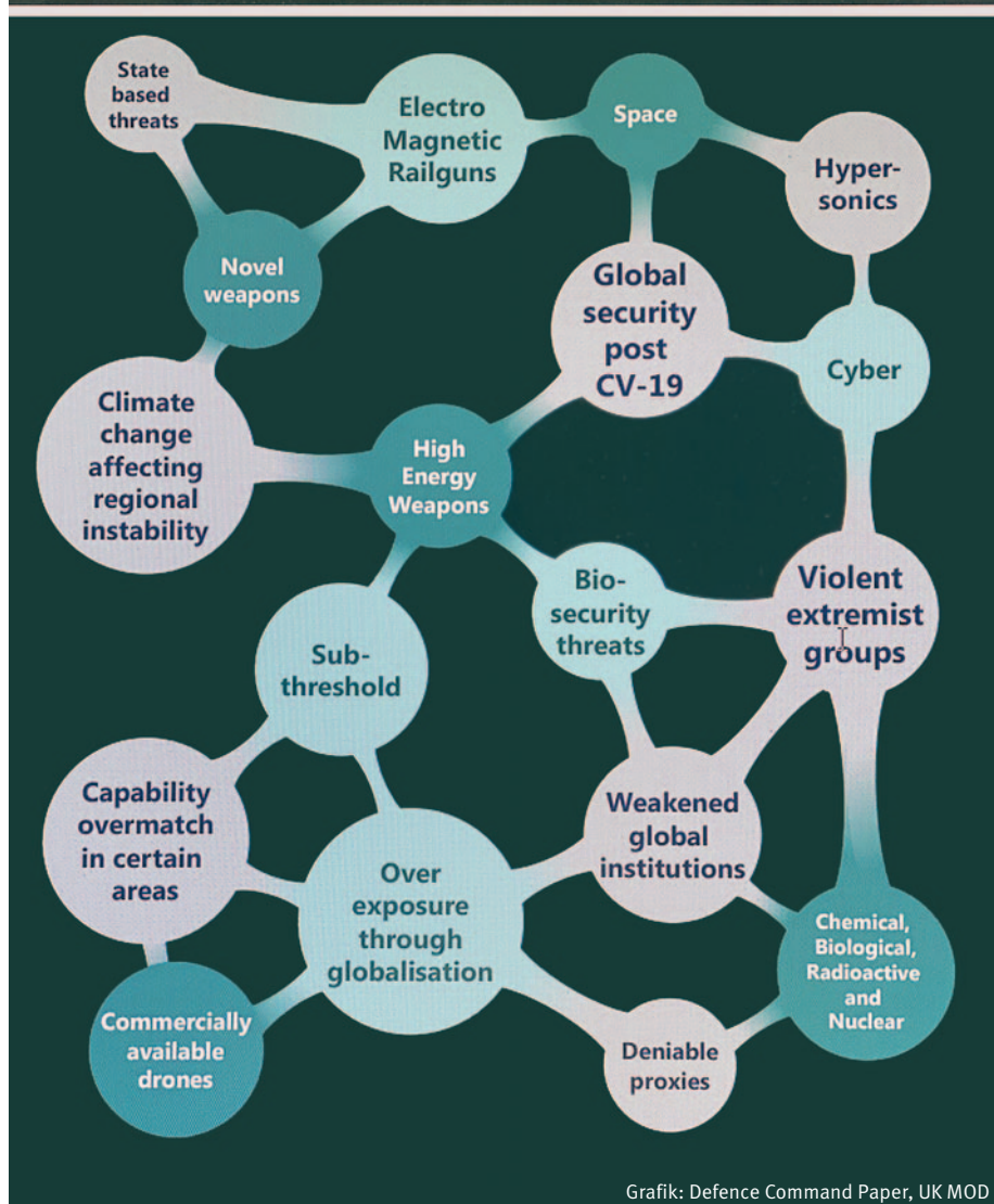
Gratik: Defence Command Paper, UK MOD